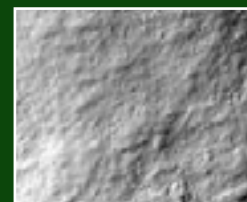
Surface de l'EcoTainer 24™