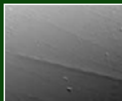
Surface non biodégradable